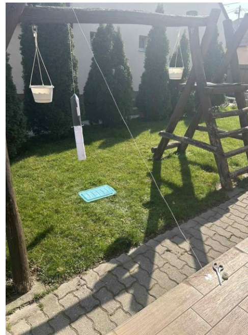
A makett kilövése